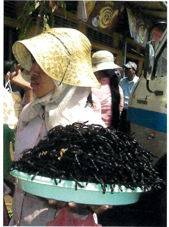
Tarántulas fritas en Camboya